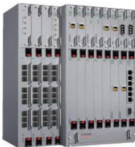
SURPASS hiT 7035

Die SURPASS hiT 70xx Serie ermöglicht echtes Multi-Service Provisioning und erfüllt die Bedürfnisse von modernen konvergenten Netzen. Es ist eine kosten-effektive Plattform, welche den gesamten Bereich aller Netzwerkanwendungen für regionale und Metro Core Dienste abdeckt. Die systemübergreifende Nutzbarkeit der Baugruppen/Karten innerhalb der SURPASS hiT 70xx Familie vereinfacht die Logistik und das Ersatzteilmanagement.