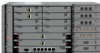
SURPASS hiT 7025