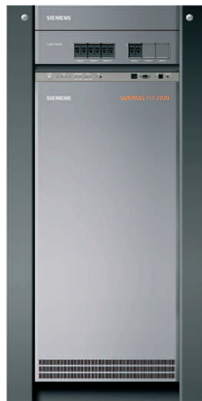
SURPASS hiT 7070